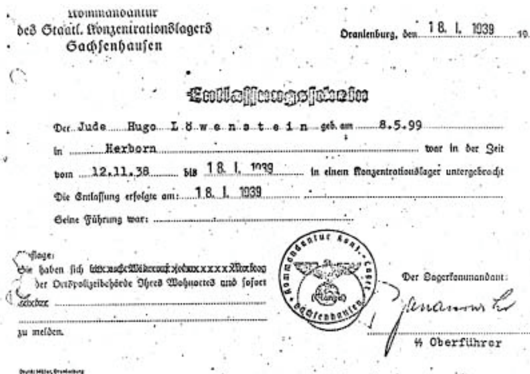
Abbildung 4: Quelle Herborner Akte

Belegt ist, dass Max Sternberg und Hugo Löwenstein in Konzentrationslager verschleppt wurden. Hugo Löwenstein wurde erst am 18.01.1939 aus dem Konzentrationslager entlassen und emigrierte im April desselben Jahres nach England.