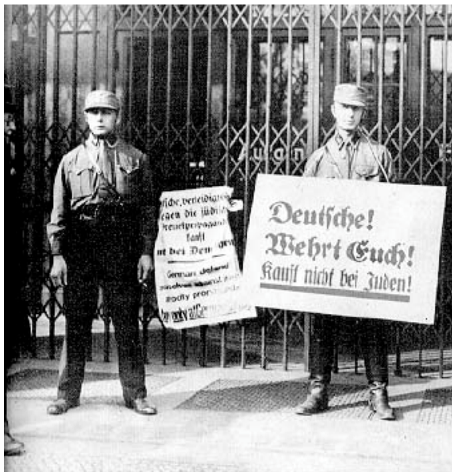
Abbildung 3: Berlin, 01. April 1933