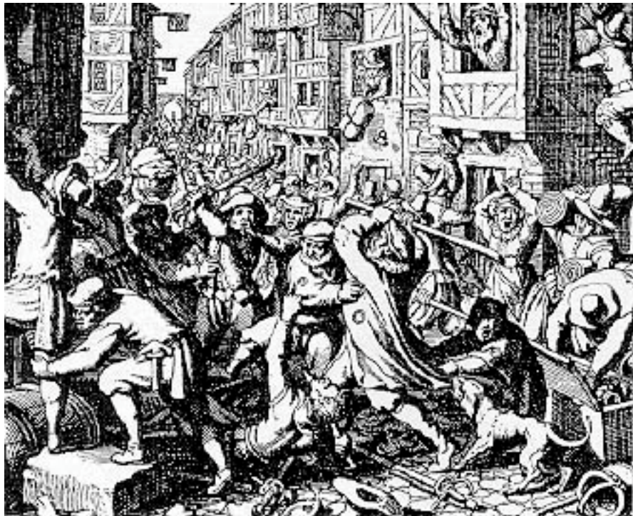
Abbildung 2: Plünderung der Judengasse in Frankfurt am Main im Jahre 1814