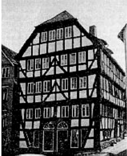
Abbildung 1: Mikwe (Kornmarkt 22)